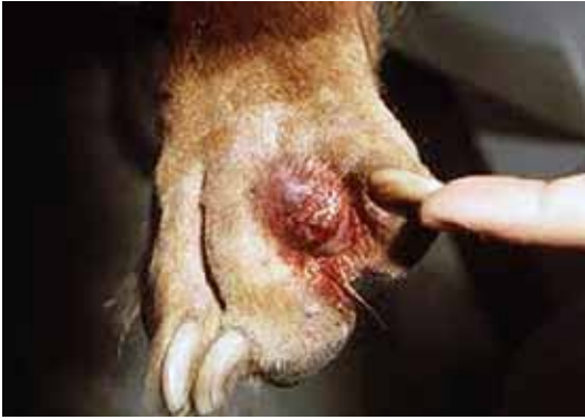
Afbeelding 2: Tussenteencyste bij de hond.