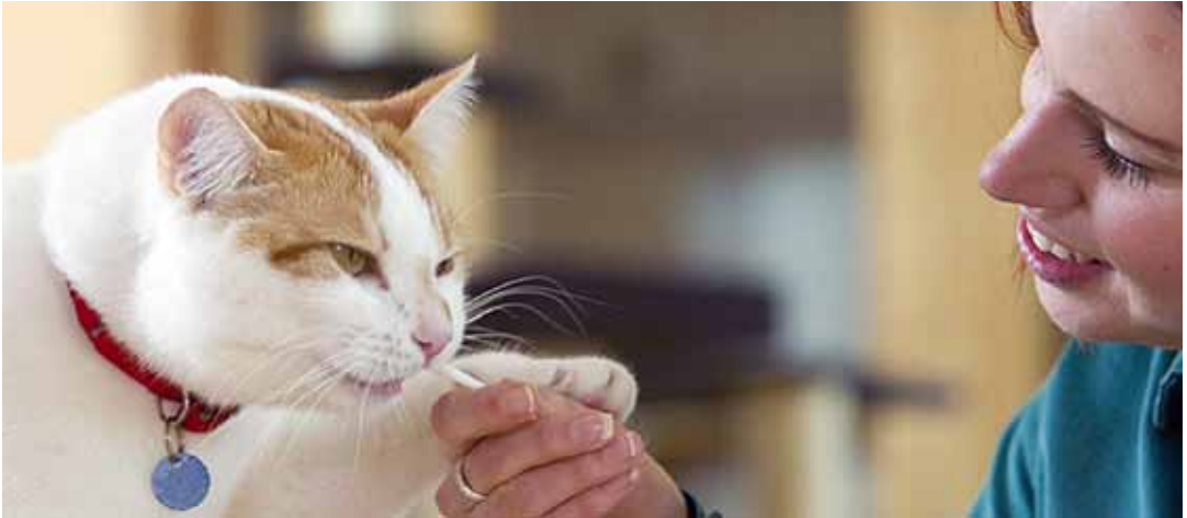
Afbeelding 9: Training kan verrijkend zijn voor de kat.