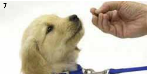
Afbeelding 6: Duidelijk agressieve signalen bij de hond.