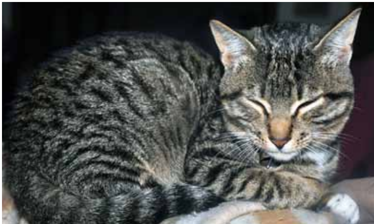
Afbeelding 8: Een kat in rust. »

Bij huisvesting in het lab is het belangrijk de dieren opties te geven, de verschillende hulpbronnen van elkaar te scheiden en in hoogte over het verblijf te verdelen, en te zorgen voor een permanent toegankelijke in- en uitgang. Mogelijkheden tot klimmen en springen en toegang tot een buitenren kunnen het verblijf verder verrijken. Uitkijkposten op hoogte kunnen de katten controle geven over hun omgeving, omdat ze de omgeving ongezien kunnen observeren. Naast deze fysieke vormen van verrijking kan ook sociale verrijking worden toegepast. De aanwezigheid van andere katten kan verrijkend zijn, maar dan moet het wel een stabiele sociale groep betreffen. Sensorische verrijking kan worden toegepast middels kattengras of valeriaan. Speelgoed kan extra bezigheid geven en ten slotte kan ook voedselverrijking worden toegepast. Bij al deze benaderingen is het van belang de effecten van verrijking te evalueren; zowel de bedoelde (positieve) effecten als eventuele neveneffecten en deze kennis mee te nemen in volgend onderzoek.