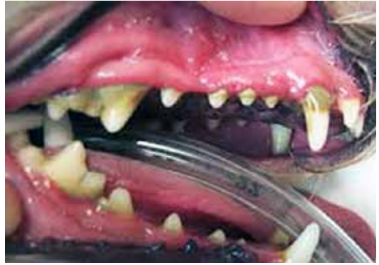
Afbeelding 3: Tandvleesontsteking (gingivitis) bij de hond.