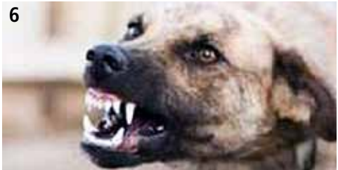
Afbeelding 5: BSAVA gedragsladder van de hond bij stress of een bedreigd gevoel.