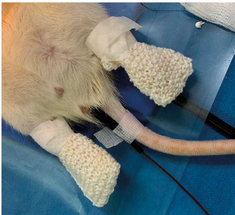
Rat met witte sokjes.