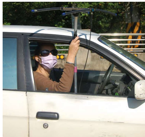
Op zoek naar onze katten.