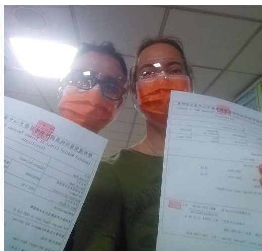
Met mondkapje, gezichtsmasker en negatieve coronatest het vliegtuig in.