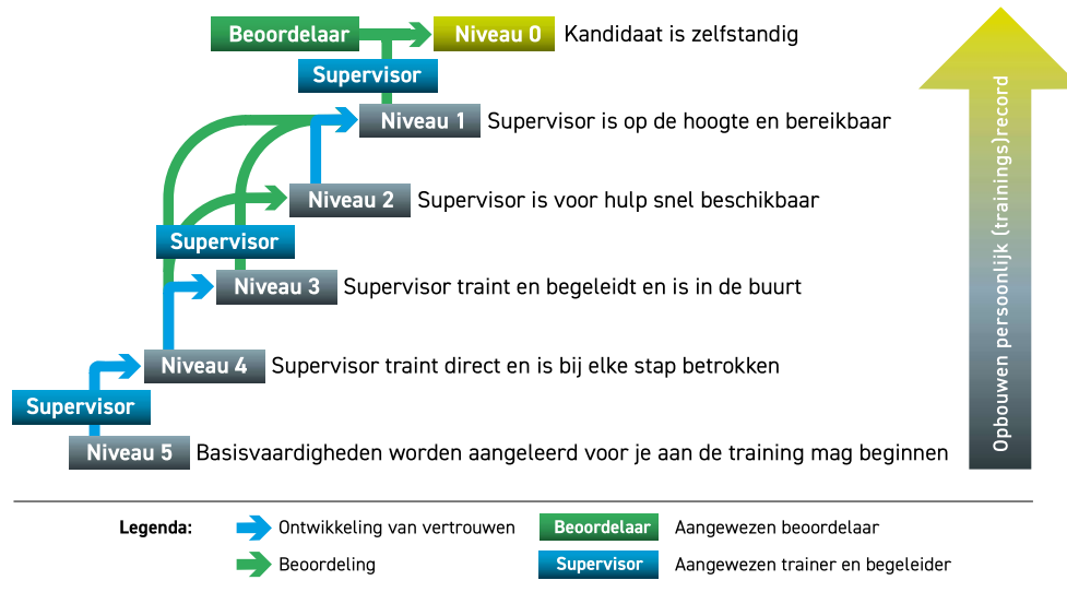
Afbeelding 2. Begeleidingsschema.

(maar wel de verzorging van dieren die in een proef staan of in het vrije veld leven). Het betreft daarmee ook altijd handelingen die niet onder de Wod vallen. Ze mogen assisteren in onderzoek, zolang er geen risico bestaat dat deze assistentie leidt tot ongerief of beïnvloeding van onderzoeksresultaten en/of onderwijskwaliteit. Deze stal-/werkveldstage wordt aangeraden voor alle nieuwe studenten en medewerkers!