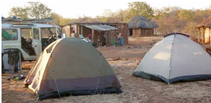
Afbeelding 2. Mukiwas in de achtertuin.