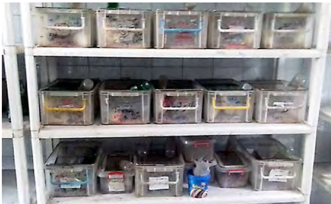
Afbeelding 3. Stelling met bakken.

dieren zelf zaten in bakken van ondoorzichtig plastic met bijbehorende deksels. Uit de deksel was een groot stuk gesneden, dat was dicht gemaakt met gaas. De bedding tijdens de cursus in november was grof houtschaafsel, inclusief een grote spijker! Deze keer was het een mengsel van fijne bedding en houtschaafsel. Al een kleine vooruitgang!