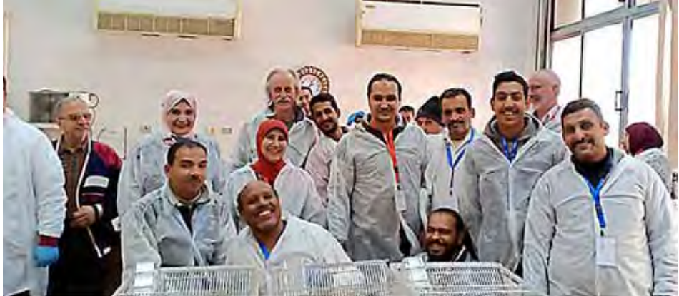
Afbeelding 1. Deelnemers van de eerste workshop, Cairo University.

was er nog een presentatie over huisvesting en kooiverrijking.